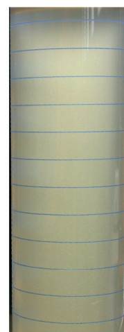
Exceso de levadura respecto a la canti- dad de CLARIFIANT XL™