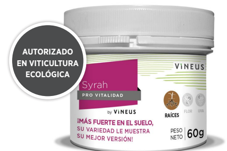
Bote de 60 gr

Antes de utilizar el producto lea detenidamente las instrucciones contenidas en la etiqueta del envase (cultivos, dosis, precauciones, etc.)