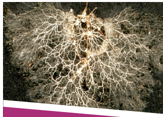
SYRAH PRO VITALIDAD

➤ Mejora el volumen de exploración radicular