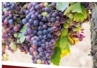
CABERNET F/S PRO PRECOCIDAD